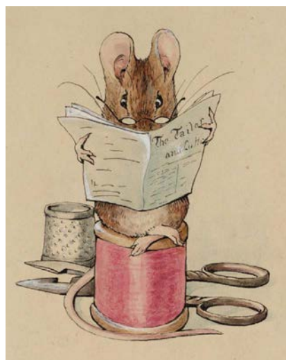
© Beatrix Potter, The Tale of the Greengoose, Frederick Warne & Co., London 1912

Ik wil geen nieuwe broek. Sacha Khodabux, Lierietje Desir van Bergen, De Eenhoorn, Eke, 2025