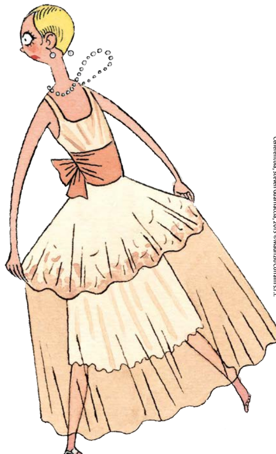
© Gertrude Steinhilber, 2013. Steinhilber Gertrude

Le Petit Chaperon Rouge. Charles Perrault, Jakob & Wilhelm Grimm, Joanna Concejo, Notari éditions, Genève, 2015