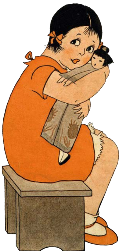
© Edina Altara, Labambolamano, copertina per "Il gnomino della Domenica", 15 gennaio 1926.

What Wesley Wore, Samuel Langley-Swain, Ryan Sonderegger, Owllet Press, London, 2020