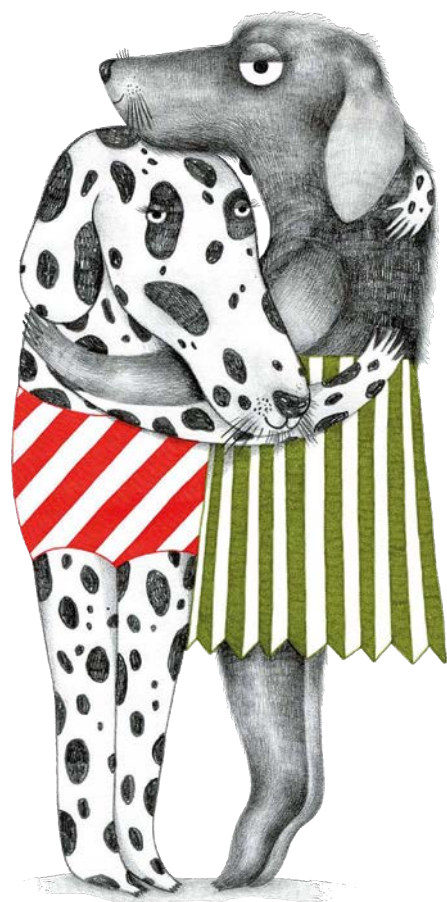
Cat: Title de «Neri» faire d'heure que d'ère henux x 2023.